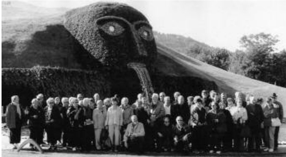
TYROL. Devant le géant du musée du cristal de Swarovski à Wattens

Du 8 au 15 octobre, le voyage au Tyrol a parfaitement honoré le programme séduisant qui avait tant attiré les inscriptions. Musique, spectacles, magnifiques paysages du Tyrol et de l'Italie. Longtemps après le retour, certains encore ne parlaient plus que de ce voyage.