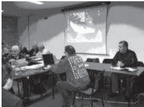
Lors de la dernière réunion

Une animation pêche sera conduite pendant le Festival country de Gramat. Le conseil d'administration va également essayer de monter des formations à la pêche au coup, à la pêche à la mouche ou à la carpe. D'autres concours de pêche sont programmés pour cette fin d'année 2011 : jeudi 14 juillet (truites), mardi 9 août (truites), samedi 15 octobre (truites).