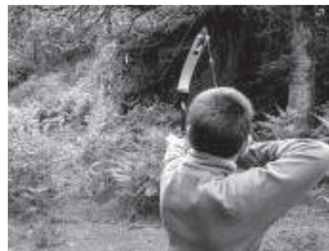
Archer gramatois en compétition sur parcours Tir 3D (Salmiech 12)

Le club Les Archers du causse de Gramat envisage d'organiser pour 2012 une compétition de tir 3D à Gramat.