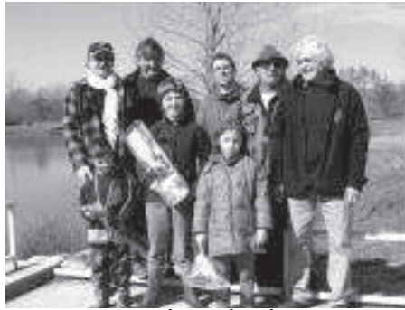
Concours de pêche du 5 mars

Des truites arc-en-ciel, un ciel bleu magnifique, des pêcheurs satisfaits d'une matinée de pêche organisée par le Gardon gramatois sur le plan d'eau