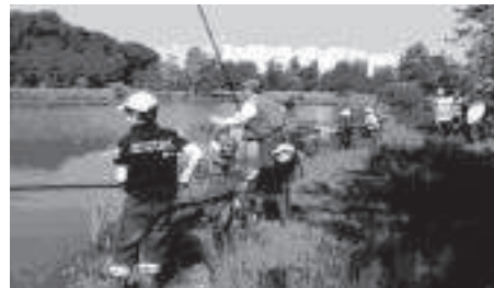
Les jeunes pêcheurs en action

Les 4 et 5 mai, onze jeunes pêcheurs, filles et garçons, ont participé à une initiation à la pêche au coup, technique qui consiste à prendre des poissons blancs : gardons, brèmes, tanches et autres carpes sur un coup amorcé par le pêcheur.