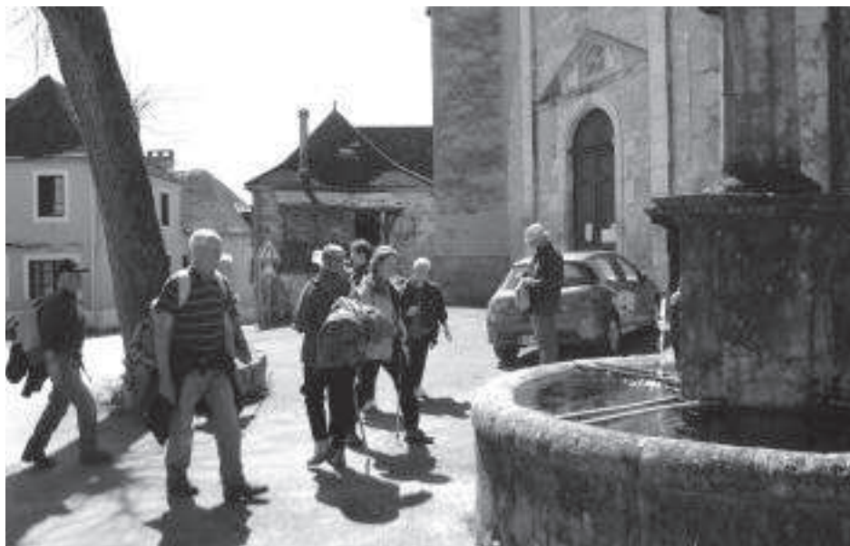
Les marcheurs à Floriac

Les responsables et bénévoles du club ont à cœur de répondre aux attentes de tous. L'objectif, c'est votre plaisir et votre satisfaction. Et aussi l'aide morale dans le partage. Alors, ne manquez pas de venir nous rejoindre, partager nos activités en