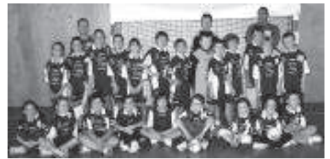
Moins de 11 ans