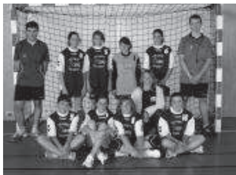
Moins de 15 ans F

finale du championnat Honneur (au but en or), elles remportent la coupe du Lot.