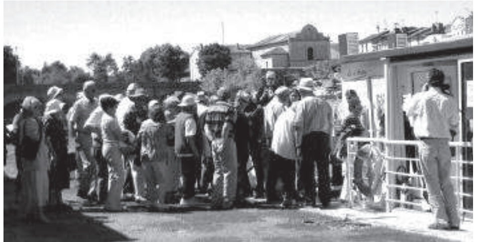
Sortie surprise : embarquement sur le d'Artagnan

- Et aussi le 18 mai la participation à la Journée de la forme organisée cette année par le club d'Issendolus.