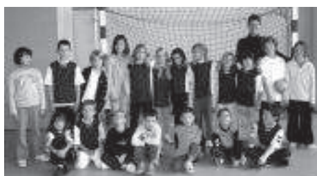
Moins de 9 ans

Il le doit aussi aux moins de 11 ans, un groupe important de 35 éléments (21 filles et 14 garçons) qui s'entraînaient le mercredi