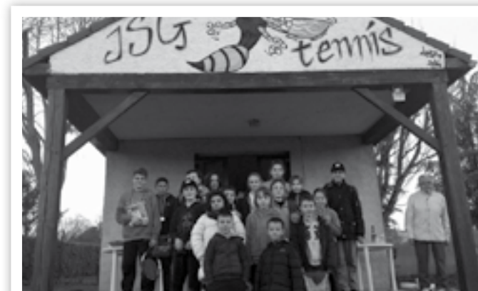
Après-midi tournoi, le 17 décembre 2016 à GRAMAT

cours donnés par un BE (Brevet d'Etat) et par un AMT (Assistant Moniteur de Tennis) et par 5 Initiateurs Fédéraux du Club de Gramat, qui eux, assurent les cours bénévolement.