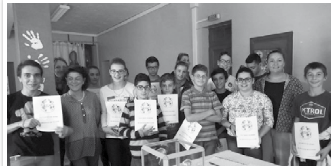
Les délégués de classe

UNE RENTREE ENCOURAGEANTE, FRATERNELLE ET PLEINE DE PROJETS !