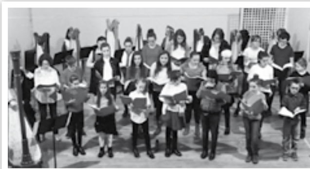
le Choeur d'enfants