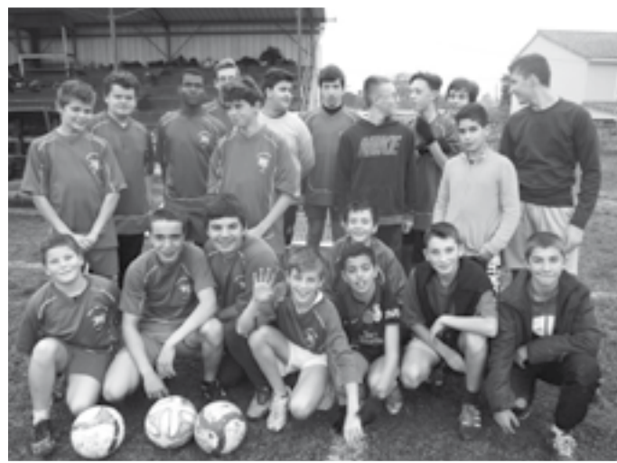
Association sportive garçons