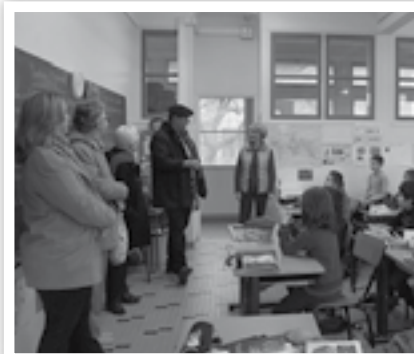
APC en primaire