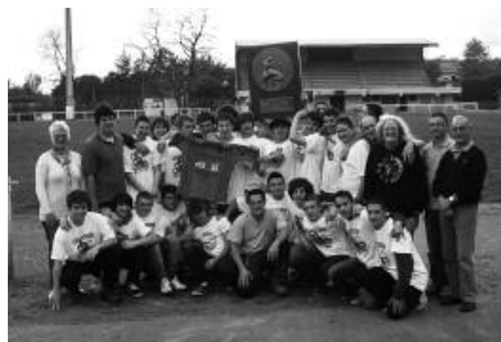
Les cadets champions du Limousin 2011-2012