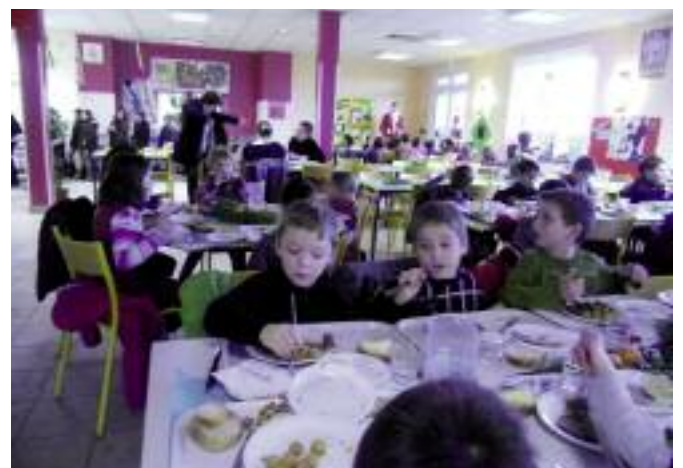
Le père Noël en visite à Sainte-Hélène