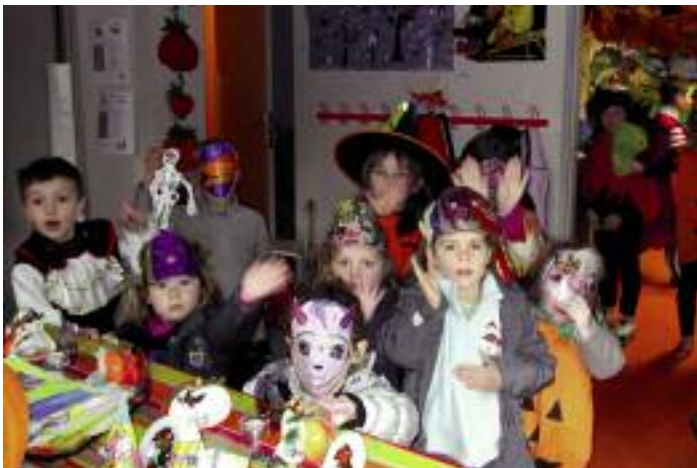
ALSH, préparation à Halloween