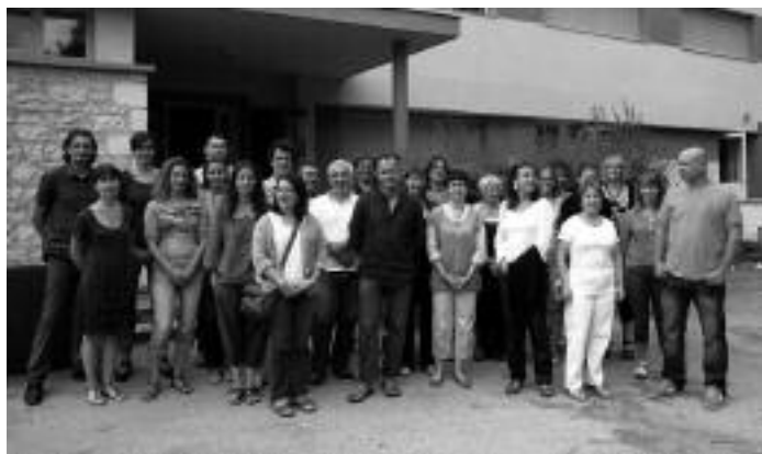
L'équipe du collège

Au niveau de la structure pédagogique, le collège compte des bilingues espagnol-anglais et des bilingues occitan en 6e, 5e, 4e et 3e (Mme Charissou) ; des latinistes dès la 5e, une section rugby filles en 4e et 3e (reconnue au niveau académique, voire national) et une option Découverte professionnelle 3h ainsi qu'une section européenne espagnol en 3e (Mme Genot).