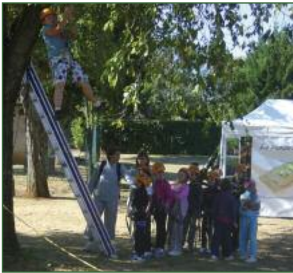
La tyrolienne des spéléos a eu du succès