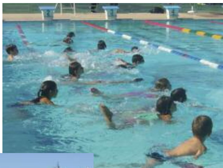
Parcours aquatique à la piscine