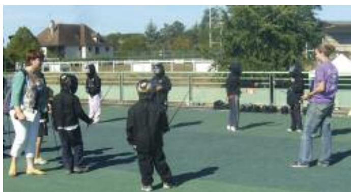
L'escrime a séduit les écoliers