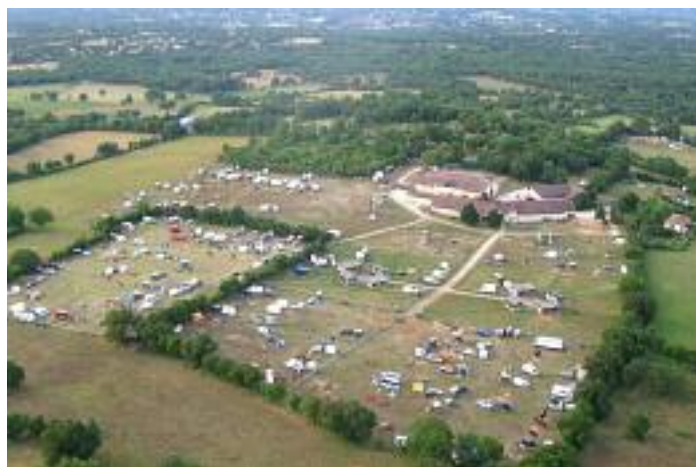
Les haras de Longayrie (Jean-Jacques Heren)

Le président d'Equiliberté, auquel se joint toute l'équipe des bénévoles, remercie chaleureusement la municipalité de Gramat, les haras nationaux de Rodez ainsi que le Conseil général sans qui cette manifestation n'aurait pas pu exister.