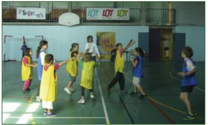
Champion olympique, le handball attire les jeunes filles et garçons