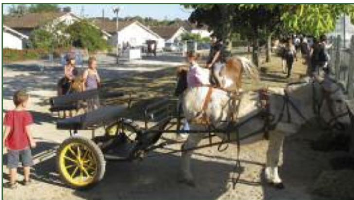
Attelage et équitation