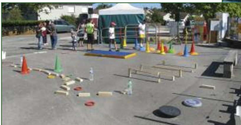
Le parcours d'équilibre a séduit petits et grands