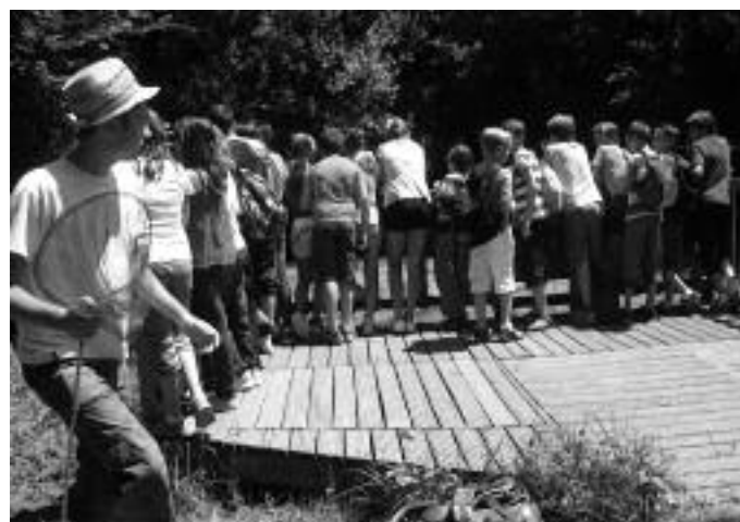
Qu'elle est belle ma sixième

régional des causses du Quercy pour étudier la biodiversité en 6e et 4e, Rallye mathématiques en 6e et 5e, visite des archives départementales en 4e, Collège au cinéma en 3e, invitation de l'auteur Michel Cosem en 5e,