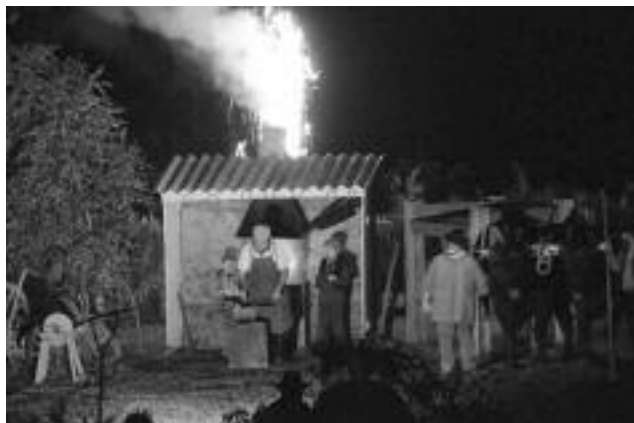
Le spectacle « Les gens d'ici »

En ce qui concerne le spectacle lui-même, une foule nombreuse y assistait et ce fut un enchantement. Tous les commentaires après le spectacle allaient dans le même sens : il aurait été dommage de ne pas venir.