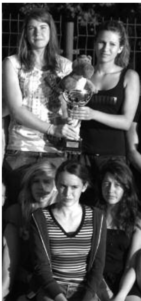
Les filles sont championnes Midi-Pyrénées comme en 2010

Gramat s'est déplacé en nombre pour participer aux interclubs toutes catégories, avec 3 équipes féminines et 4 masculines mais aussi en qualité puisque l'équipe 1 filles est championne Midi-Pyrénées et l'équipe 1 garçons se classe cinquième.