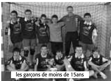
les garçons de moins de 15ans