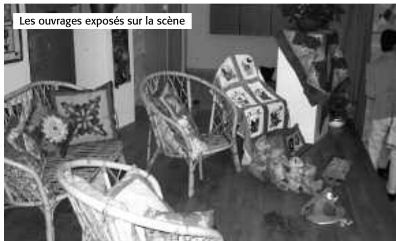
Les ouvrages exposés sur la scène