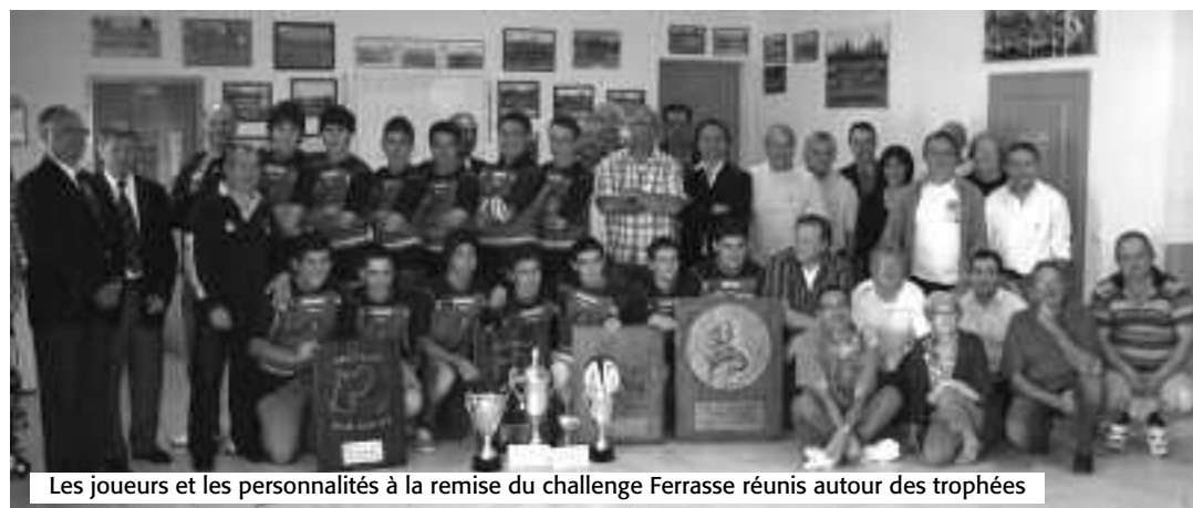
Les joueurs et les personnalités à la remise du challenge Ferrasse réunis autour des trophées

Les différents orateurs ont souligné le dynamisme du groupement de Gramat-Figeac-Lacapelle, les qualités pédagogiques et humaines des entraîneurs, le dévouement constant des bénévoles et les capacités prometteuses des joueurs qui ont remporté les trophées sur le pré. Cette récompense est une consécration pour le GFL fort de 90 joueurs.