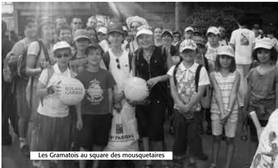
Les Gramatois au square des mousquetaires

Le club a financé une partie de cette sortie ce qui fait que le prix demandé était raisonnable.