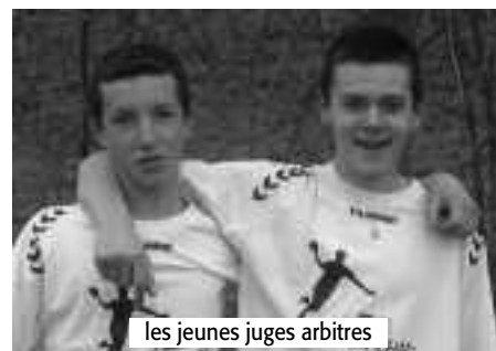
les jeunes juges arbitres