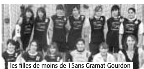
les filles de moins de 15 ans Gramat-Gourdon