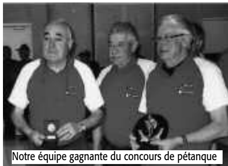
Notre équipe gagnante du concours de pétanque