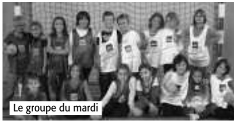
Le groupe du mardi