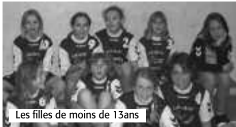
Les filles de moins de 13 ans