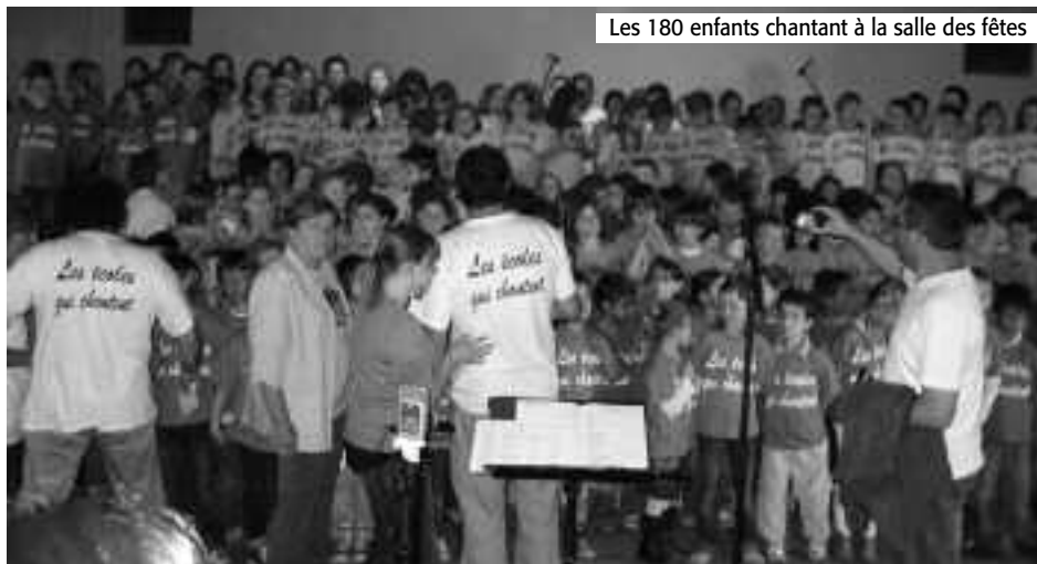
Les 180 enfants chantant à la salle des fêtes