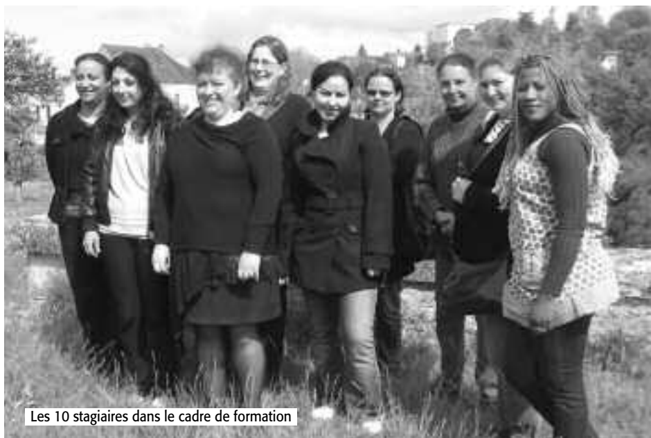
Les 10 stagiaires dans le cadre de formation

Pyrénées, en partenariat fort avec Agefos PME Midi-Pyrénées, l'Etat (échelon régional et départemental de la Direccte), Pôle emploi et IRFA-Sud, et grâce à l'importante implication des associations intermédiaires, Emploi services (Gramat) et Bouriane Solidarité (Gourdon) et des futurs employeurs potentiels (service d'aide à domicile de la Croix-Rouge, Optim'Services, ADAR...).