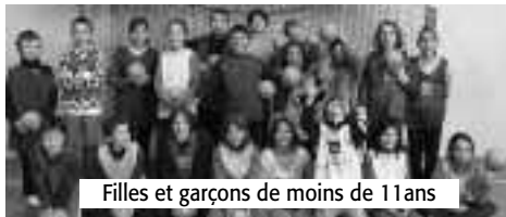
Filles et garçons de moins de 11 ans