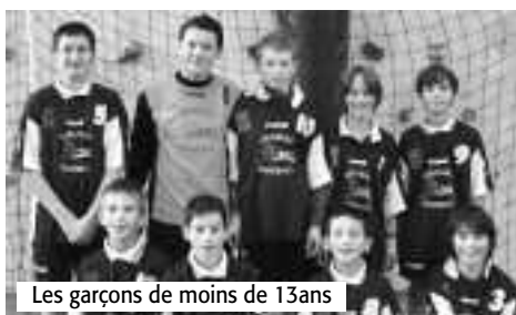
Les garçons de moins de 13 ans