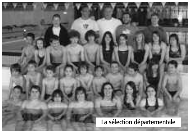
La sélection départementale

Le jeudi après-midi était consacré à des activités dans la neige (luge). Hébergés à l'hôtel Central, au Pas de la Case, les Gramatois ont bénéficié d'excellentes conditions d'entraînement dans la magnifique piscine de 25 m du centre sportif et n'ont eu qu'à se louer du formidable accueil, particulièrement chaleureux, du personnel de la piscine.