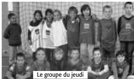
Le groupe du jeudi