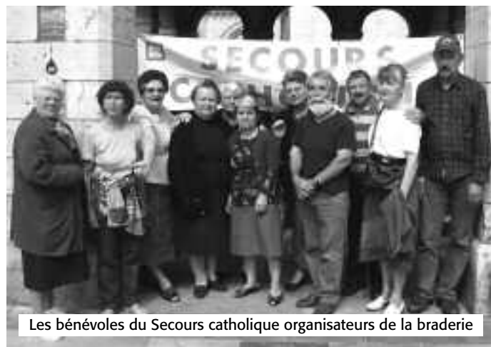
Les bénévoles du Secours catholique organisateurs de la braderie