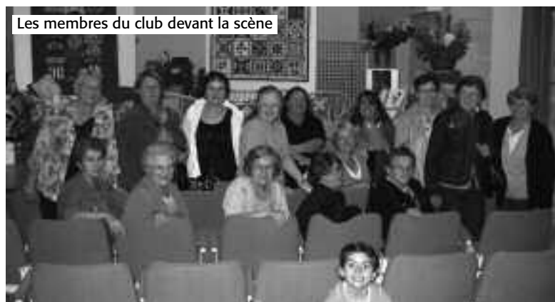
Les membres du club devant la scène