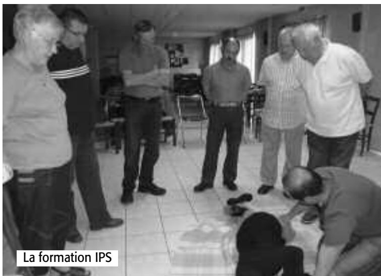
La formation IPS