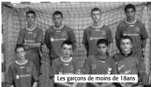
Les garçons de moins de 18ans