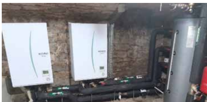
Les raccordements et équipements de chauffage.

Dans le cadre du Schéma Directeur de l'Immobilier et de l'Énergie (SDIE), la Commune de Gramat a planifié une opération de rénovation énergétique de son parc immobilier. La première étape a concerné le bâtiment de la mairie. Le pôle social, le pôle culturel (cinéma et médiathèque), le pôle artistique (Louis Mazet) suivront également mais ces rénovations relativement onéreuses seront étalées sur plusieurs années.