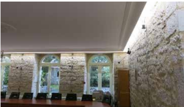
L'éclairage rénové de la salle du Conseil Municipal.