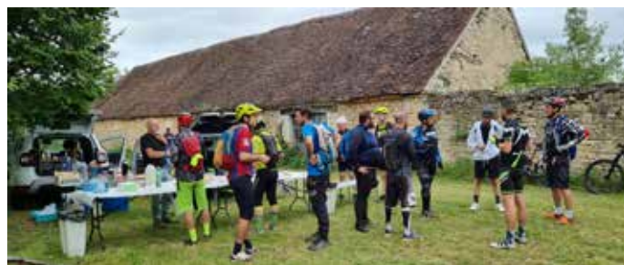
Poste de ravitaillement sur la cause de Gramat lors du circuit des merveilles du 16 juin 2024

Nous vous donnons rendez-vous en 2025 pour de nouvelles aventures.