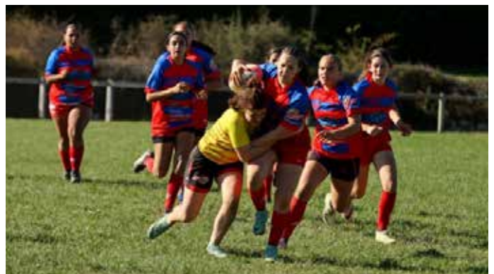
Première journée Challenge OCCITAN à Gramat

La configuration du club de rugby de Gramat se stabilise cette année avec une poursuite des actions engagées la saison passée, notamment pour les ententes avec le RRNQ et le RCBBV. L'ambition du club est de relancer une équipe féminine sénior en propre la saison prochaine de manière à continuer l'aventure initiée il y a maintenant plus de 50 ans. Dans l'immédiat, des matches ont déjà eu lieu et d'autres sont prévus au stade Pierre de Coubertin dans toutes les catégories d'âge (des minimes aux séniors). Venez nombreux les encourager !