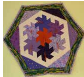
Patchwork le safran réalisé par la première présidente du Club des Petits Chiffons de l'Alzou