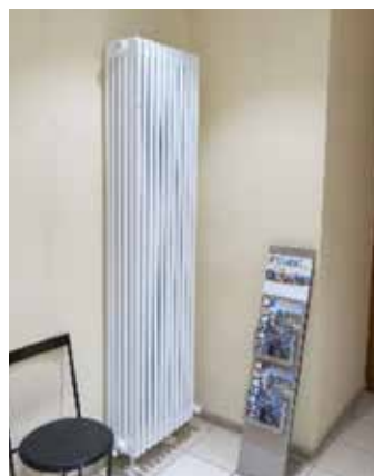
Des nouveaux radiateurs basse température installés.