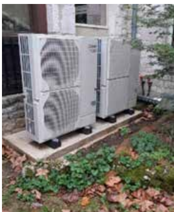
Les deux pompes à chaleur en cascade.