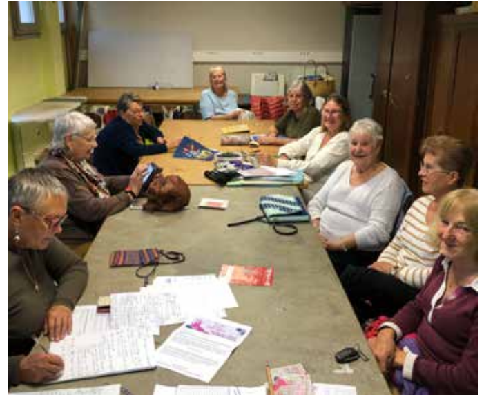
Réunion de l'assemblée générale du 7 octobre 2024

Deux nouvelles patcheuses nous ont rejoint, pourquoi pas vous ?